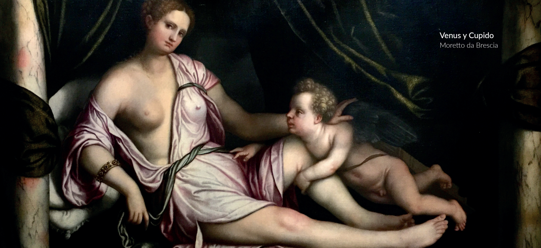
Venus y Cupido Moretto da Brescia