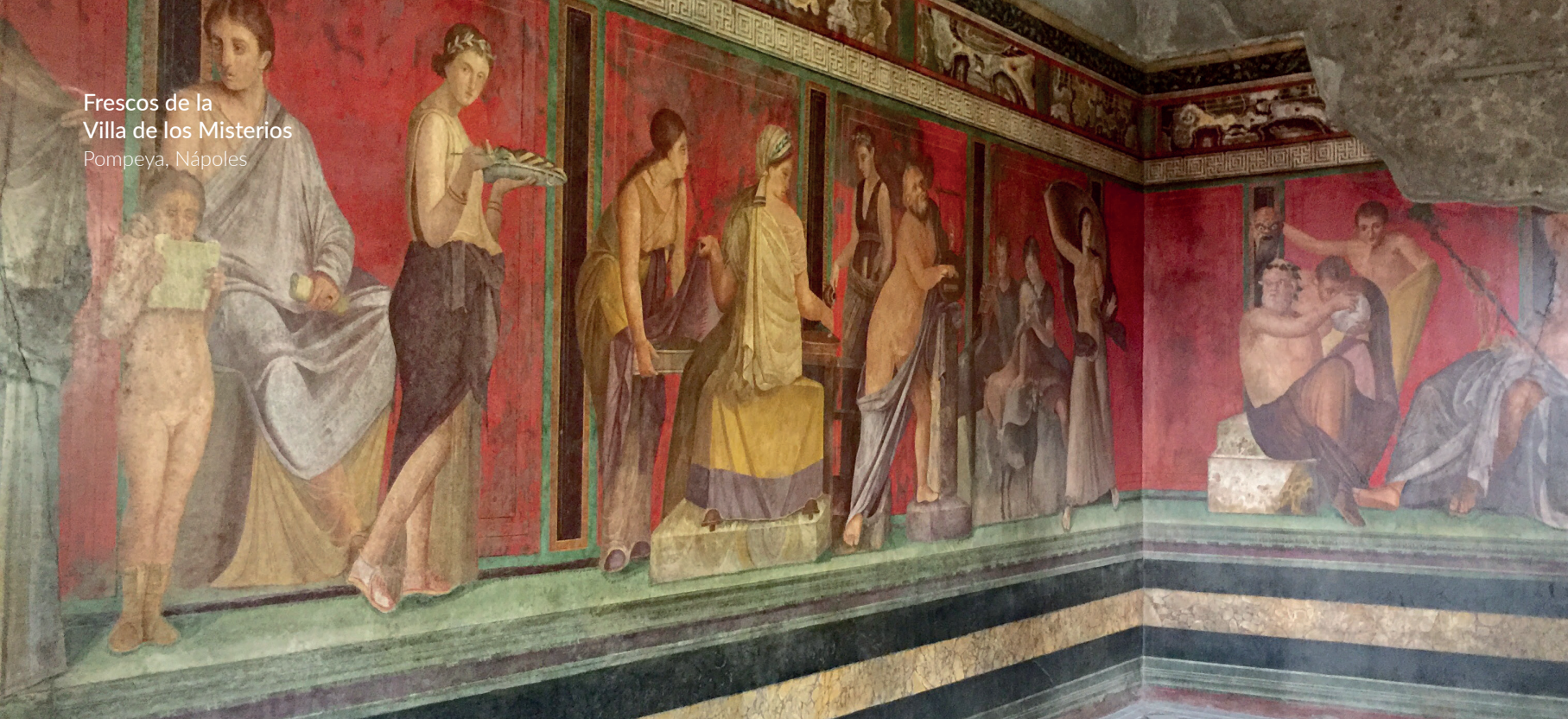
Frescos de la Villa de los Misterios Pompeya, Nápoles